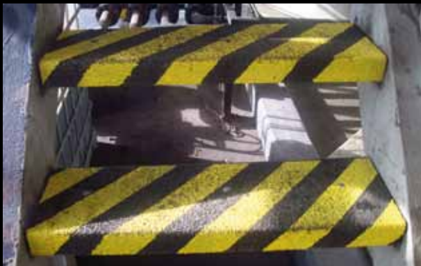
► Marches d'escalier Xtra Grip, noir jaune, vissées