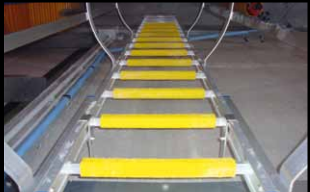
► Profils de sécurité pour échelles Xtra Grip, jaune, collés