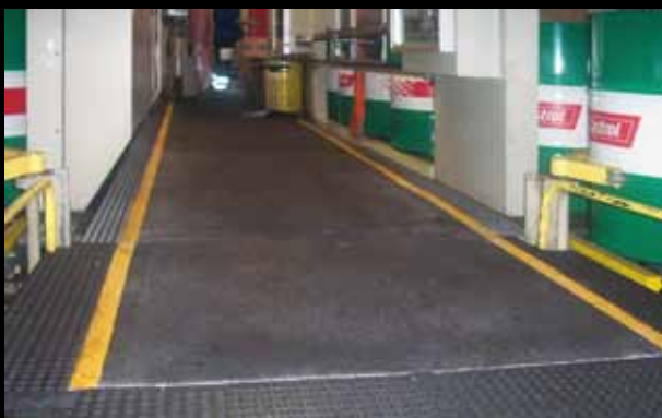
► Passages Xtra Grip, vissés sur plateforme de grille