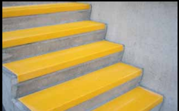
► Marches d'escalier Xtra Grip, jaune, collées