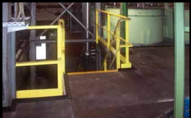
► Plaques Xtra Grip, coupées sur mesure et vissées sur plateforme de grille