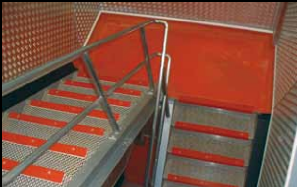
► Nez d'escalier et palier Xtra Grip, rouge