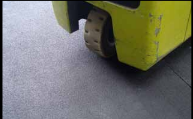
► Plaque Xtra Grip, noir