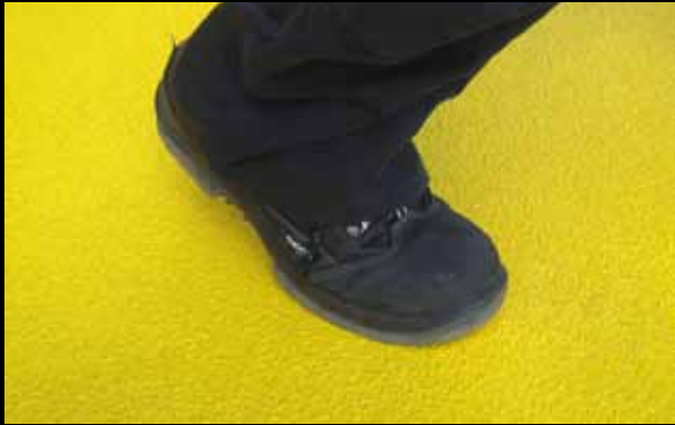
► Plaque Xtra Grip, jaune